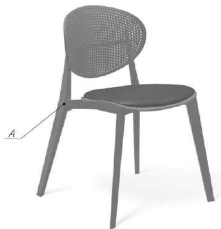
Общий вид изделия