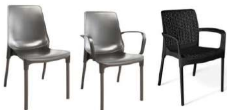
Общий вид изделия